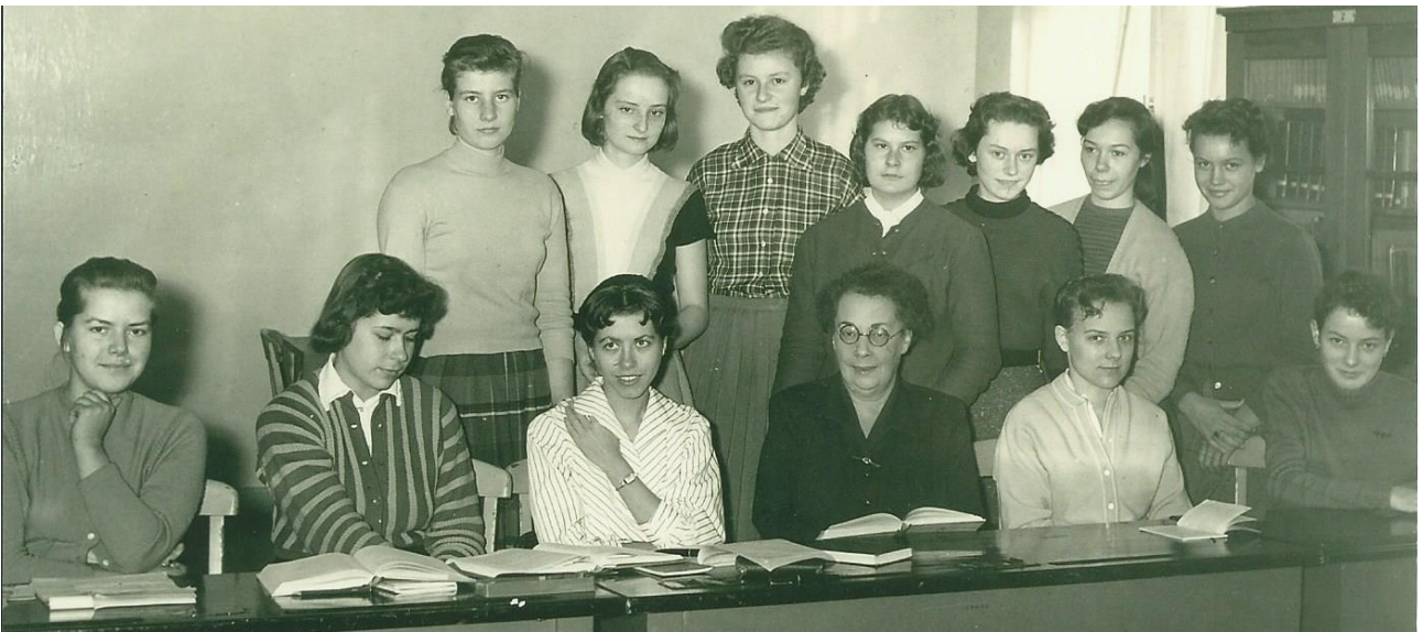
Abiturklasse 1957

Und der einen vor in der S.S. Füh- rung. 1945 haben ihn die Russen aufgehängt. Dafür verzeiht man ihnen manches andere. Übrigens